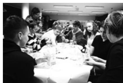
Készülnek a karácsonyi apróságok – díszek és ajándékok