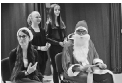
A Mikulással kezdődött minden