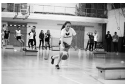
Vetélkedő a tornateremben