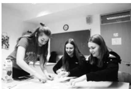
Szellemi párbaj, vicces feladatokkal