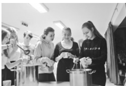
Karácsonyi hangulathoz süti és tea