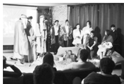
Megható perceket élhettünk át társaink előadásával