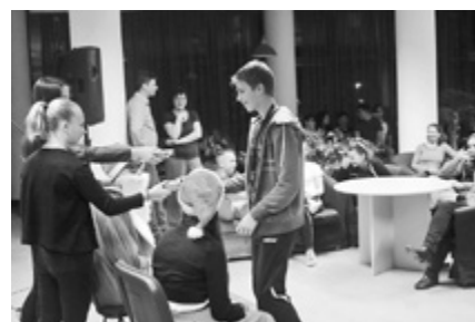
.A legrendesebb szobák lakói külön ajándékot kaptak a Mikulástól