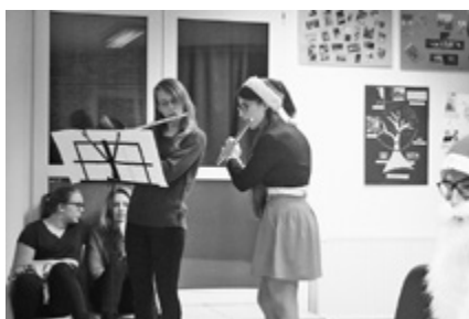
A Mikulást izgatottan...és zenével vártuk