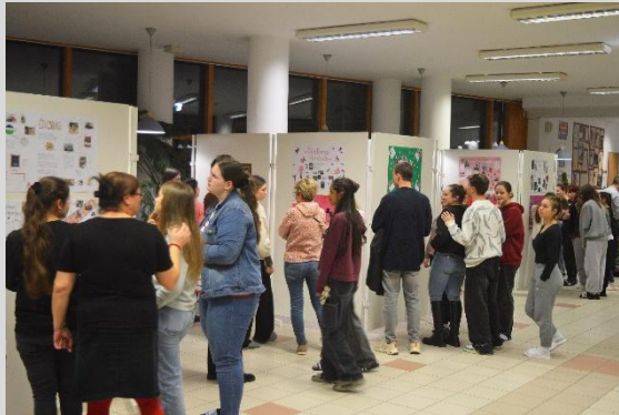
A magyar kultúra napján