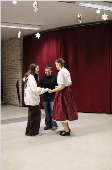
Az I. Klebelsberg jótékonyági bál műsorát a diákok állították össze