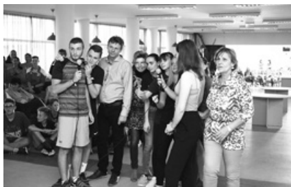
9. vs. 12. évfolyam