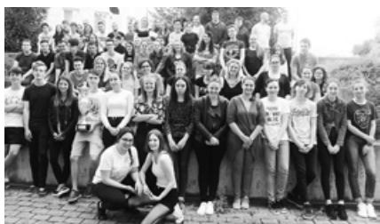
Akik sokat tettek a Klebiért