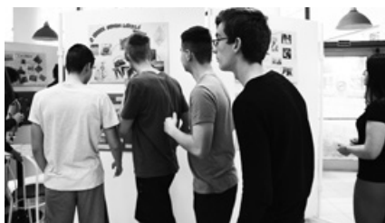
Ilyenek vagyunk – A 10. AJTP bemutatkozása