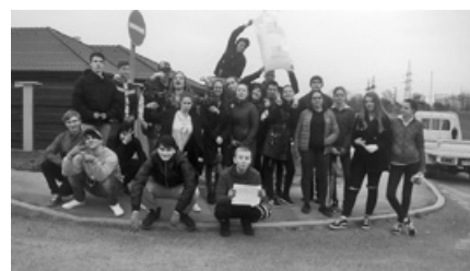
Idén is csatlakoztunk a Te szedd! kezdeményezéshez