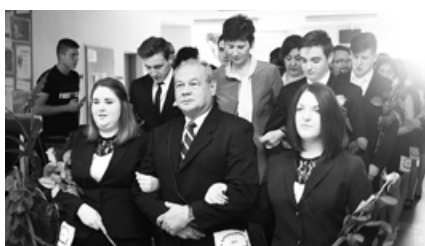
Búcsú a Klebitől