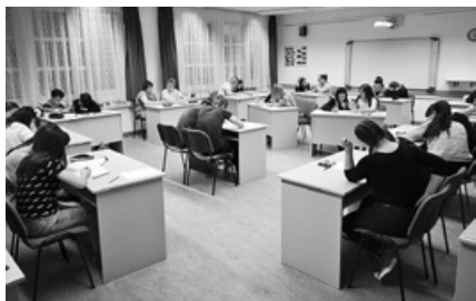
A Nyelvelünk vetélkedő szakított a hagyományokkal