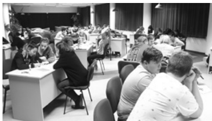
A magyar nyelv napját vetélkedővel ünnepeltük