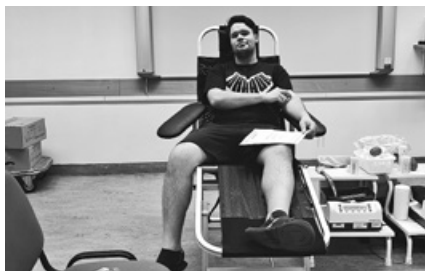
Minden évben segítünk