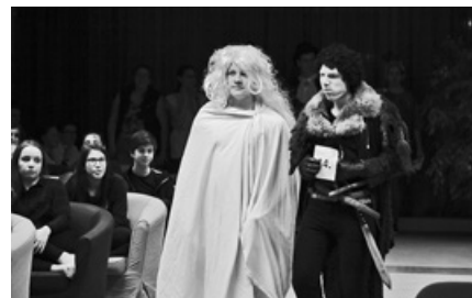
Középkori hangulatot teremtettek a 10. évfolyamos diákok a farsangon