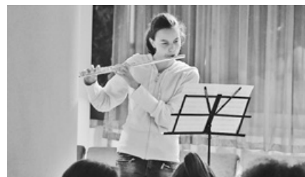
A zene világnapján tehetséges zenészek mutatkoztak be