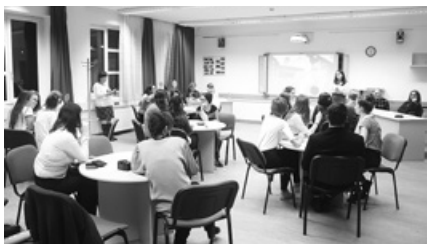
A Kányádi-vetélkedőn a város irodalomkedvelő középiskolásai versengtek