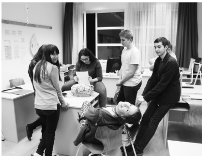
Élveztük a vetélkedőt