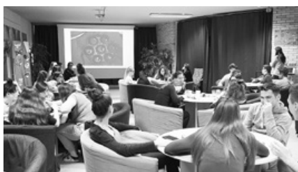
A Tudás fáját nem volt egyszerű megszerezni