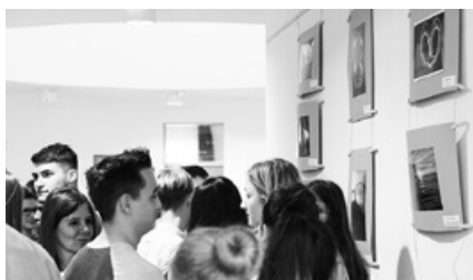
Fény-kép fotókiállítás megnyitója