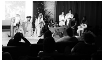
A karácsonyi műsor meghitt pillanata