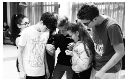
9. vs. 12. évfolyam