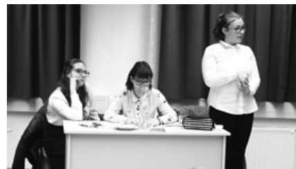
A hagyományosan megrendezett Klebelsberg-vetélkedőn a kilencedikesek bizonyították tudásukat névadónkról