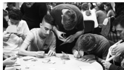
Nemcsak karácsonykor, hanem húsvétkor is alkotunk