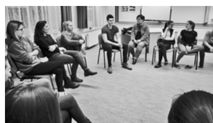
Egykori kollégistáink élménybeszámolóját hallhattuk