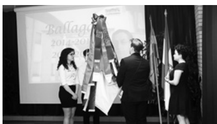
A zászlóátadás pillanata