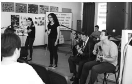
A Klebelsberg Pedagógiai Napon a kollégiumi zenekar is szerepelt