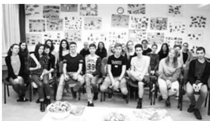
Az idegen nyelvi fordítóversenyen sokan vettek részt