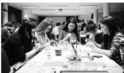
A karácsonyi kézműves-foglalkozáson szép ajándékok készültek