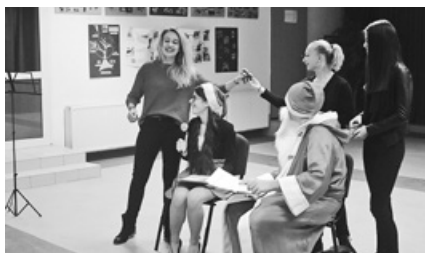
A Mikulás kívánságokat is teljesített