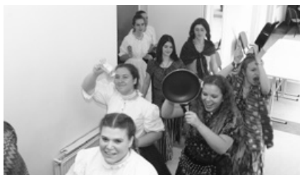
A meghívás önfeladt pillanata