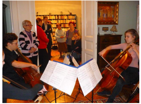
2016. december 7-én, 9.00 és 10.30 óra között, Óvodások karácsonyváró hangversenye