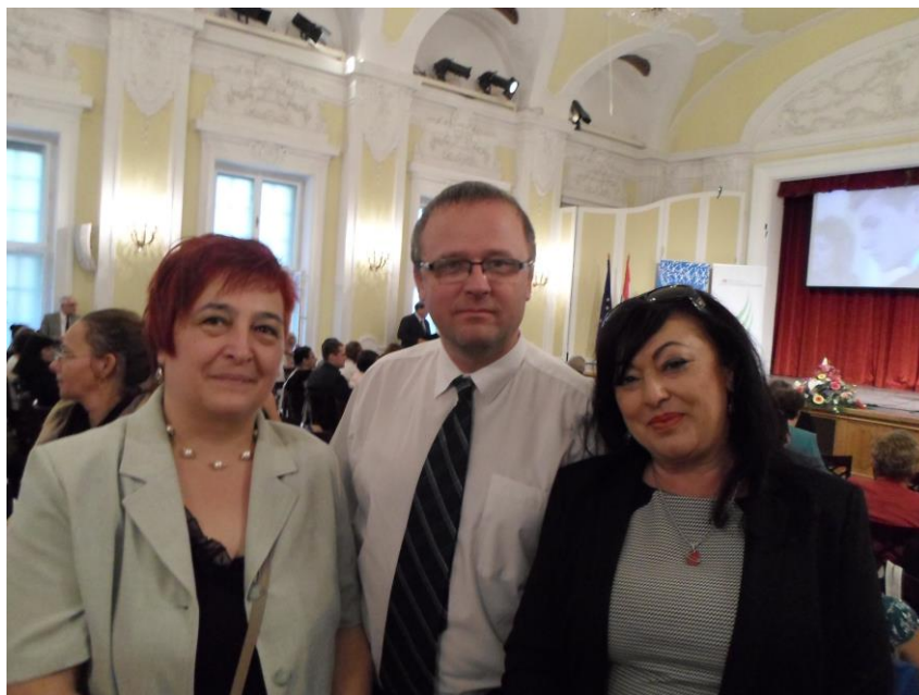
Európai Tehetségponttá váló intézmények képviselői