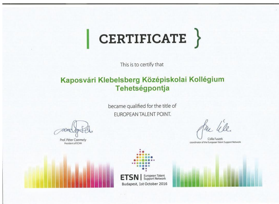
Kaposvári Klebelsberg Középiskolai Kollégium oklevele

2016. október 1-jén került megrendezésre a Tehetségpontok idei őszi találkozója, aminek a Budai Ciszterci Szent Imre Gimnázium adott otthont. A magyarországi Tehetségpontok képviselői szakmai előadások keretében hallhatták a tanévet érintő legfontosabb szakmai terveket, projekteket, pályázati lehetőségeket. Személyesen vehették át továbbá a tavasszal sikeresen lezajlott akkreditációt tanúsító elismeréseket, valamint az Európai Tehetségponttá váló intézmények is most kapták meg a regisztrációjukról szóló okleveleket.