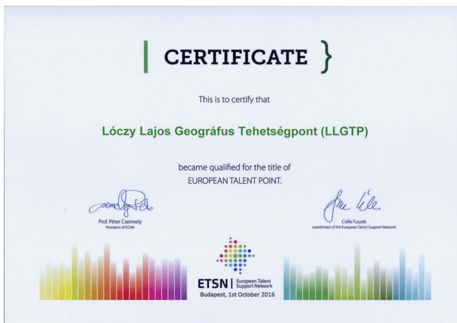
Lóczy Lajos Geográfus Tehetségpont oklevele